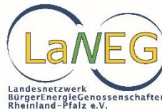
Landesnetzwerk Bürgerenergiegenossenschaft Rheinland-Pfalz e.V. (LaNEG e.V.)