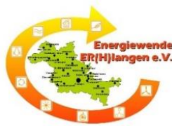
Energiewende ER(H)langen e.V.