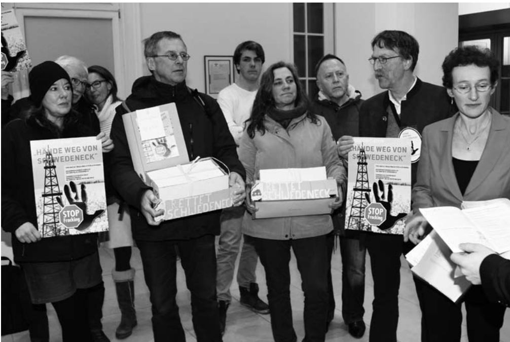
Breite Ablehnung von Fracking und Ölförderung: Bürgerinitiativen, Wasserwerke, Getränkehersteller, der Bauernverband und Umweltverbände lehnen Fracking ab. Mittlerweile haben alle beteiligten Ölkonzerne ihre Förderabsichten zurückgegeben. Zuletzt durch massive Proteste aus Schwedeneck, wo durch die Initiative „Hände weg von Schwedeneck“ am 25.1.2017 über 84.000 Unterschriften an die Landesregierung überreicht wurden. Ende März 2017 gab Dea (Deutscher Erdölkonzern AG) als letzter Konzern die Bewilligung für das Feld Schwedeneck-See zurück. (uws)